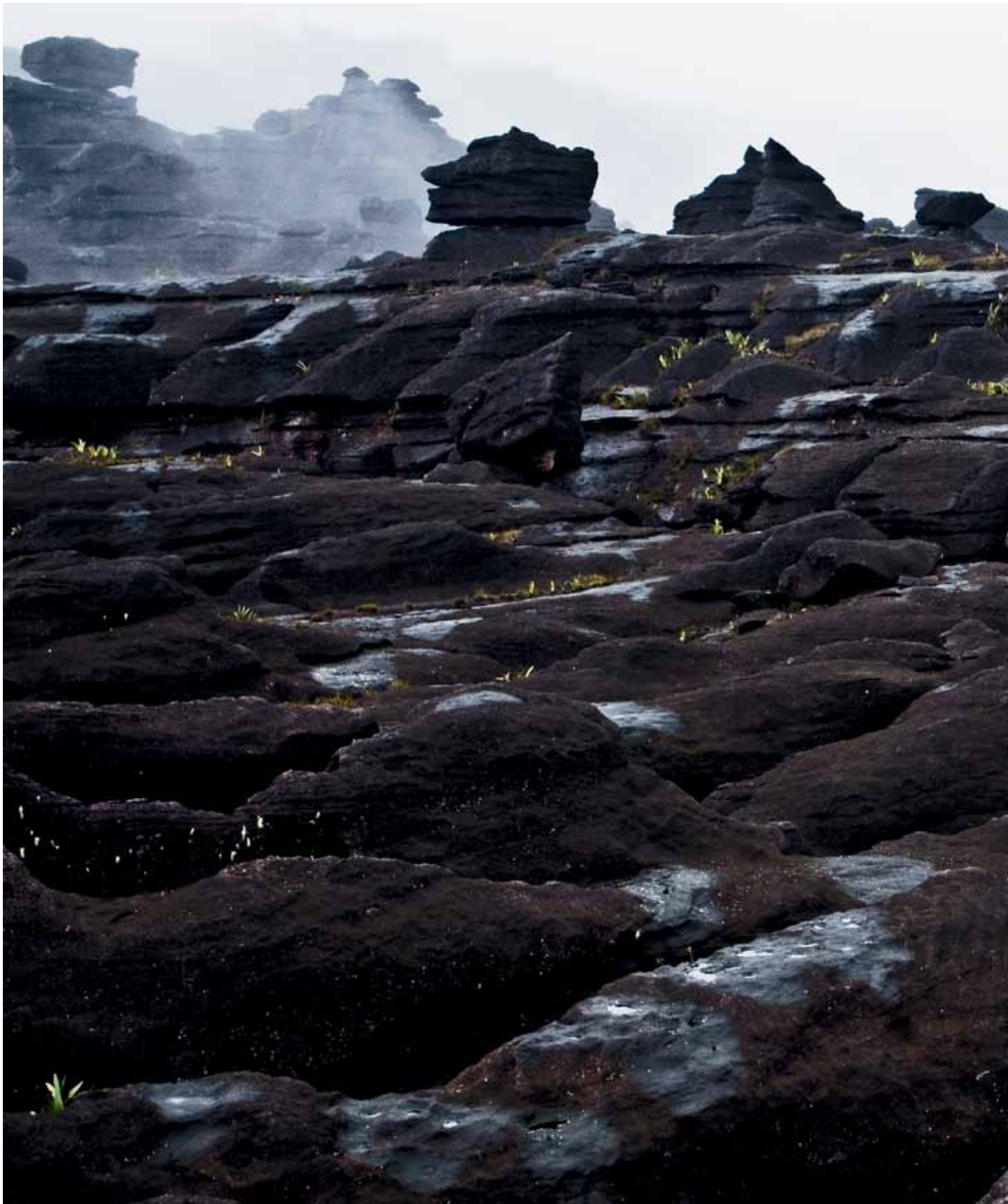
180 Formação rochosa no alto do Monte Roraima | Rock formation at the top of Monte Roraima