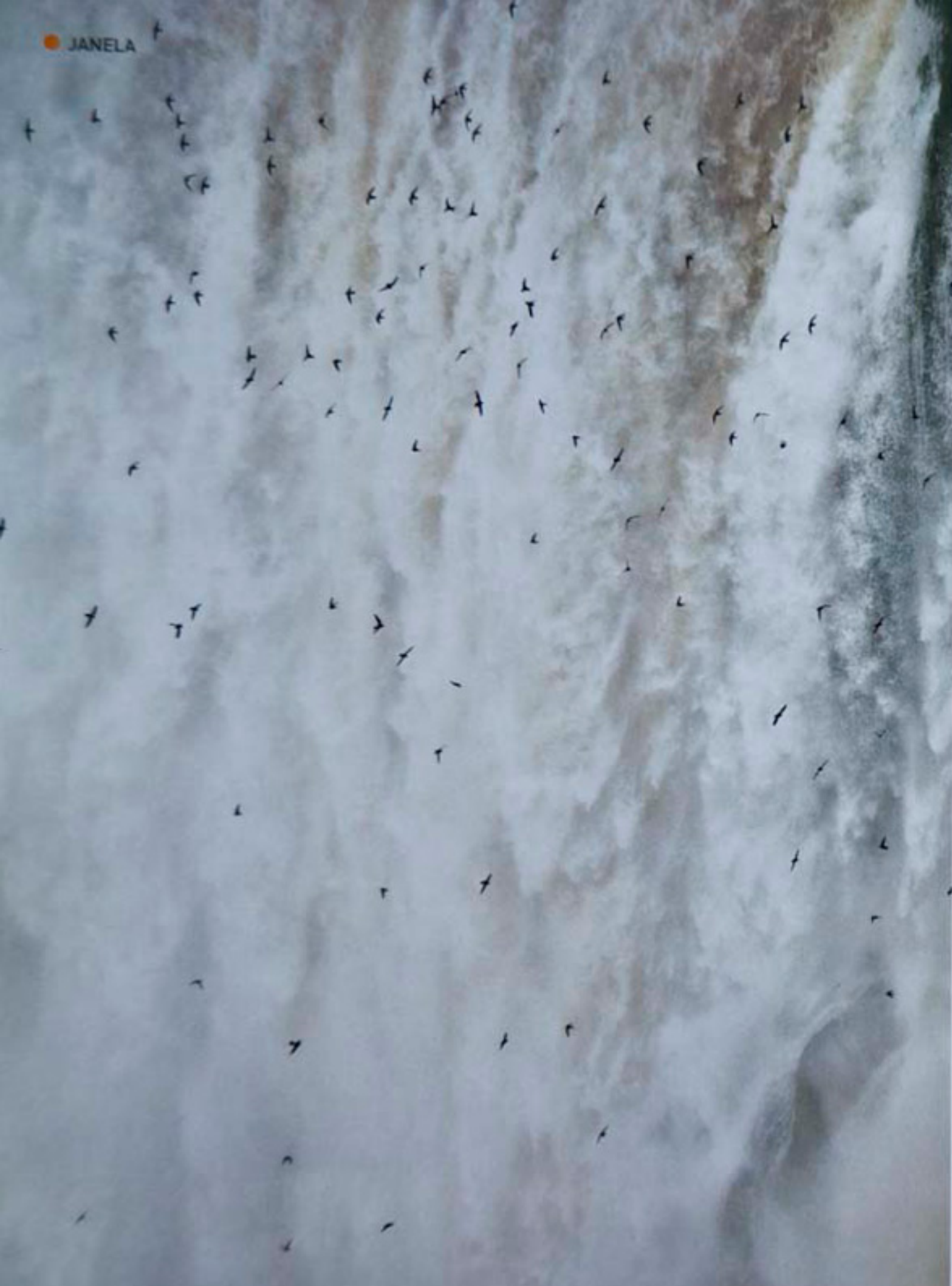
Andorinhas sobrevoando a Garganta do Diabo, nas Cataratas do Iguaçu