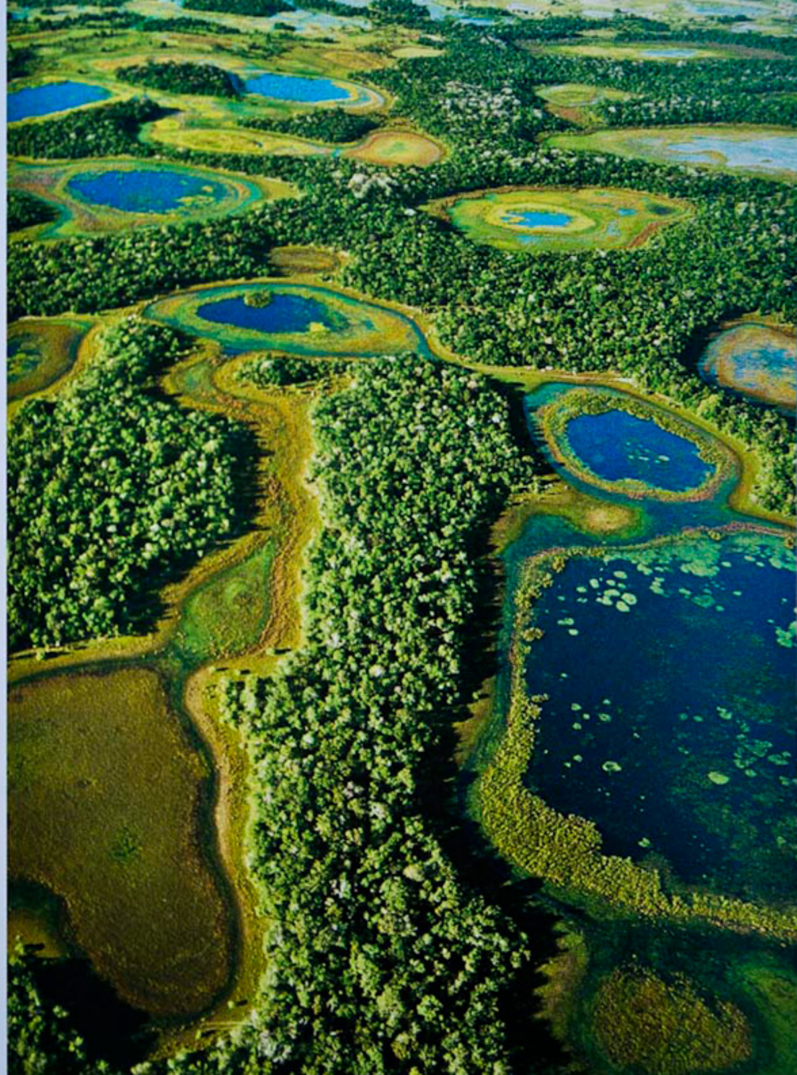
Vista aérea do Pantanal Sulmatogrossense