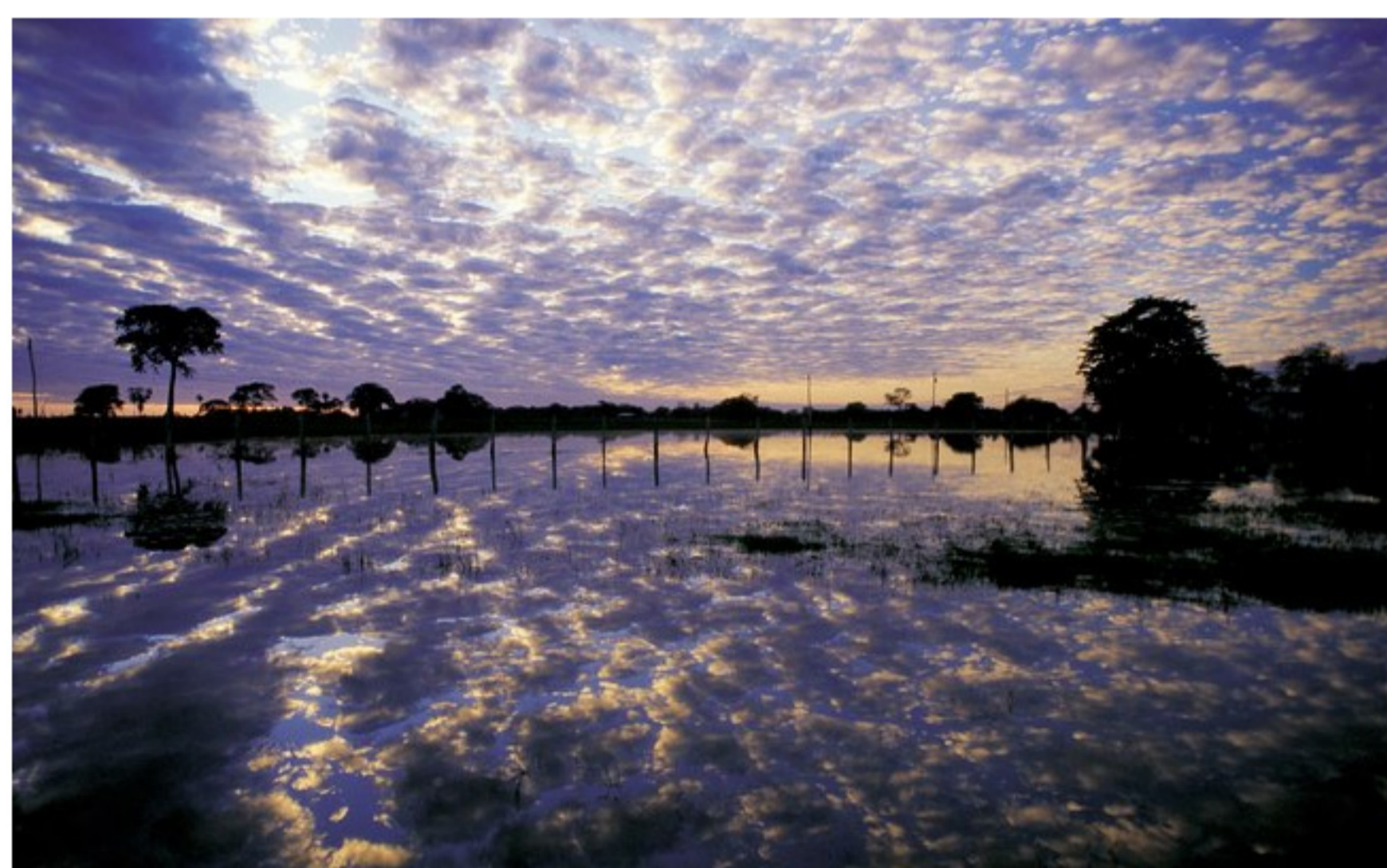
Abuse dos reflexos das águas e dos espelhos para fazer imagens inusitadas da viagem - Foto do Pantanal no período da cheia

Não adianta fotografar de dentro do carro ou em um barco com muita velocidade. A não ser que você tenha uma máquina com regulagem para essas coisas. Mas, nesse caso, você provavelmente já saberá o que fazer. "Se você estiver em movimento, vale arriscar. Afinal, você não está pagando mais nada. Só não espere a oitava maravilha do mundo", alerta o fotógrafo.