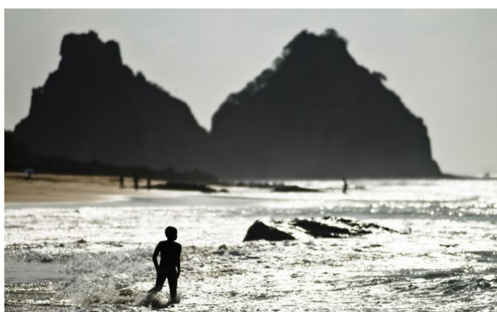
Fernando de Noronha foi umas das sete regiões brasileiras retratada pelo fotógrafo Valdemir Cunha para o livro Brasil Natural

Prestes a lançar seu mais novo livro, "Brasil Natural" (Editora Origem), que reúne as melhores imagens captadas em sete regiões brasileiras, Cunha conversou com o iG Turismo e deu dez dicas para fotógrafos amadores tirarem bons cliques na viagem.